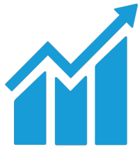
TRABAJO DECENTE Y CRECIMIENTO ECONÓMICO

Reconocemos nuestra responsabilidad en este proceso y estamos plenamente comprometidos a contribuir de manera significativa con la reducción de nuestro impacto ambiental y la promoción de prácticas comerciales responsables .