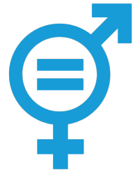
IGUALTAT DE GÈNERE