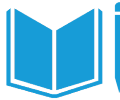
EDUCACIÓ DE QUALITAT